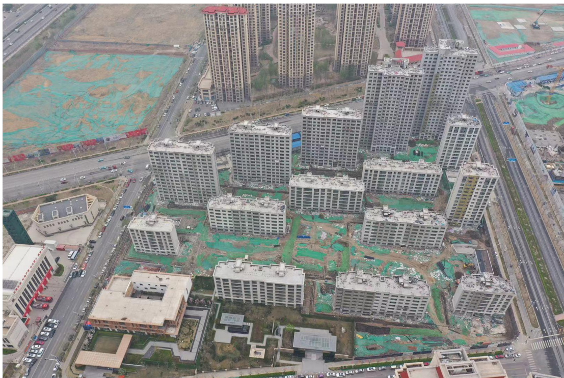
图 1-1 工程现状