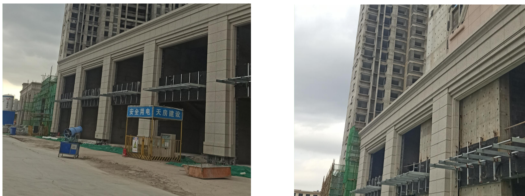
图 3-1 现场照片