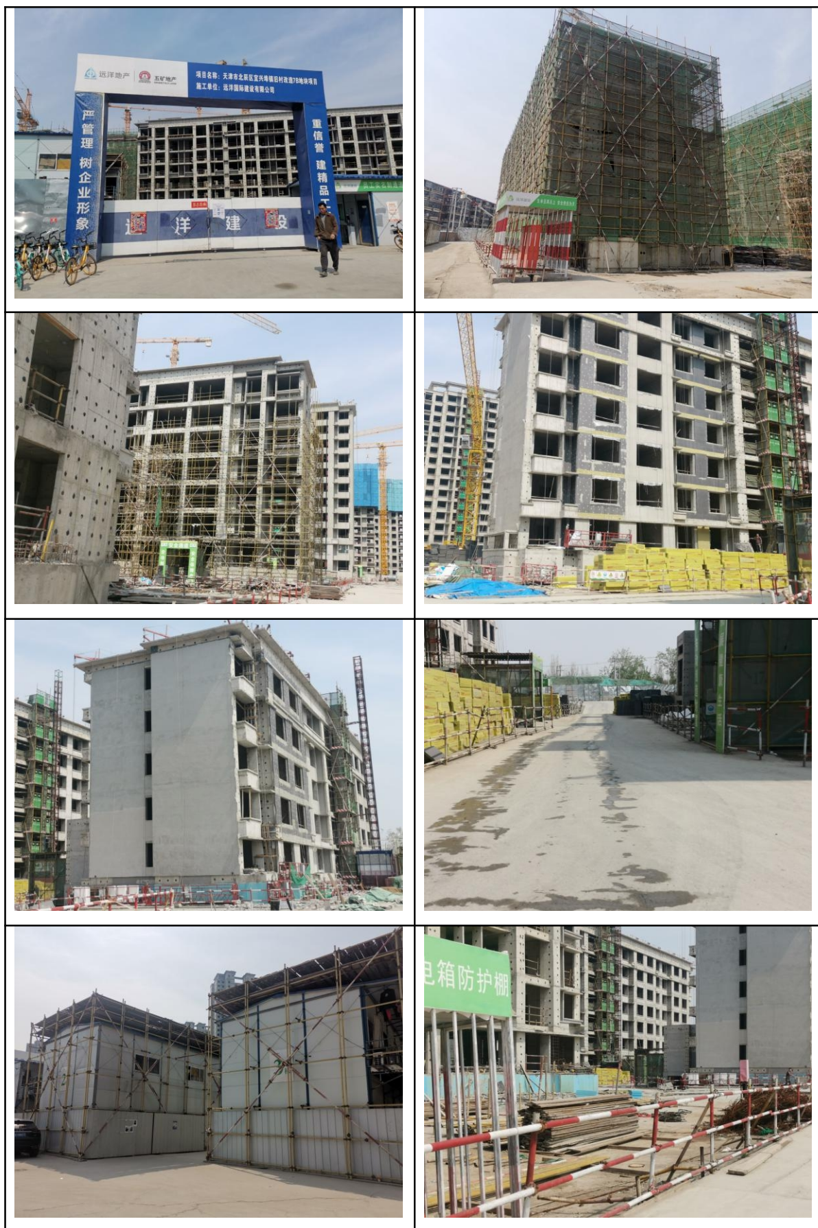
图 1-1 工程现状