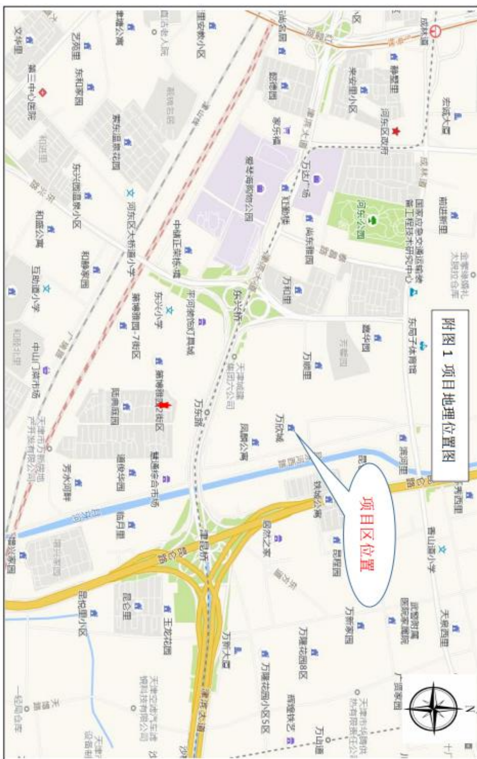
附图 1. 项目区地理位置图