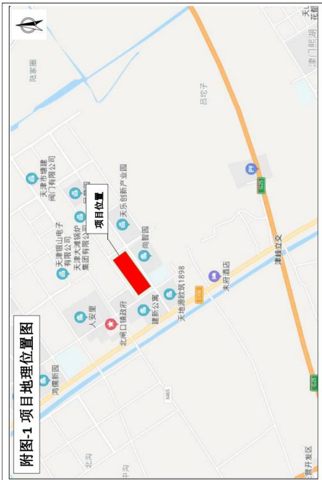
附图 1. 项目区地理位置图