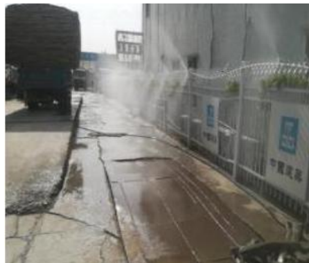
图 3-1 现场照片