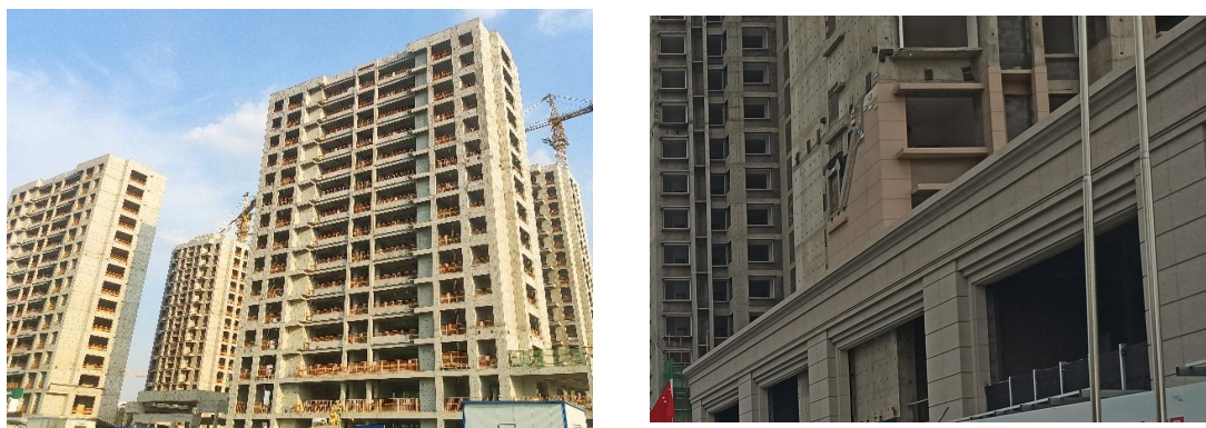
图 3-1 现场照片