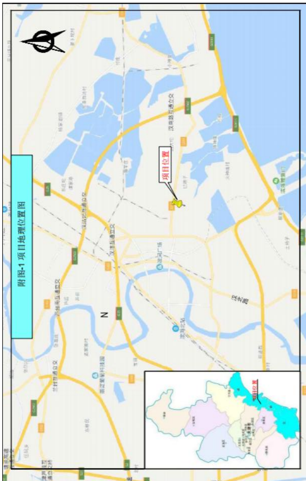
附图 1. 项目区地理位置图