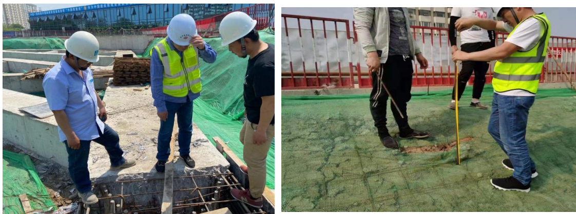
图 3-1 现场照片