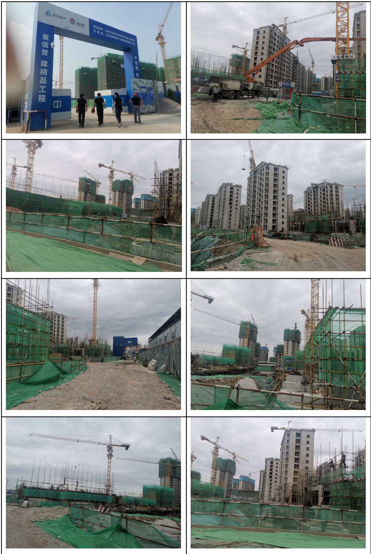
图 1-1 工程现状