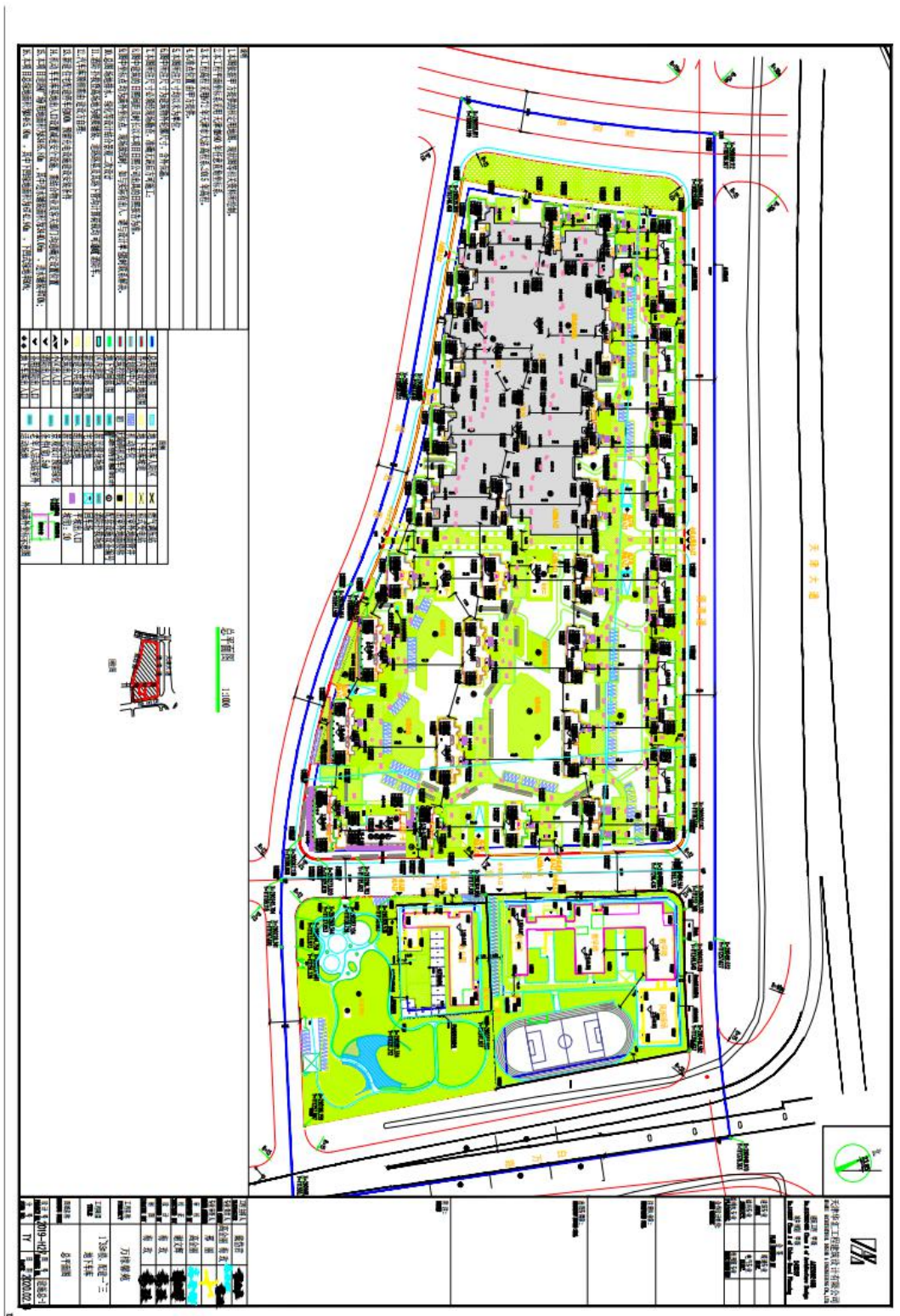
附图 3. 防治责任范围图