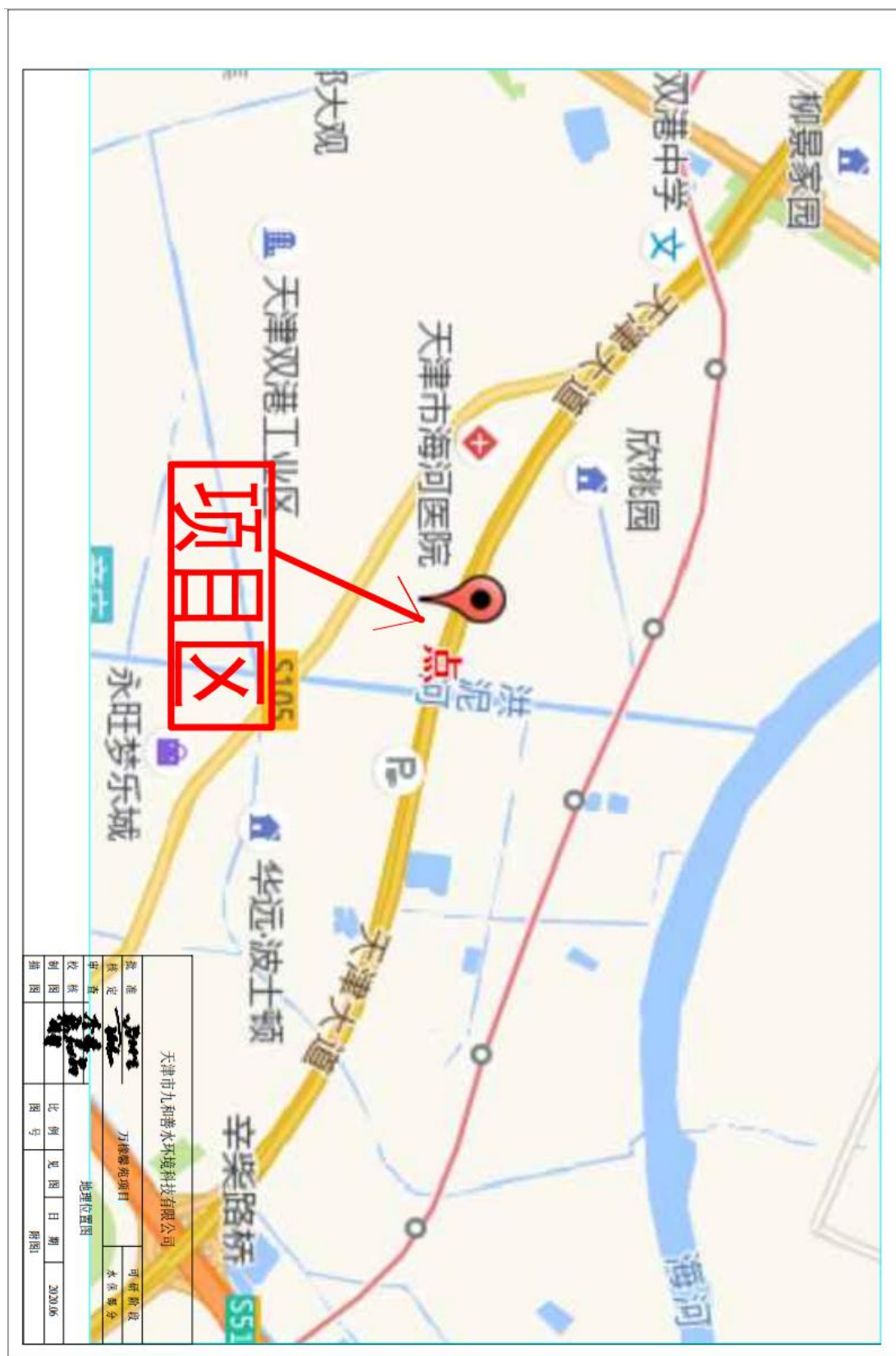
附图 1. 项目区地理位置图