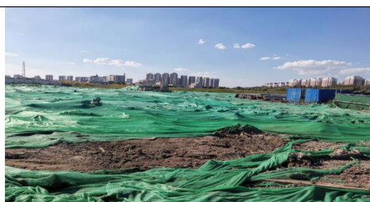
临时苫盖（未施工部分）